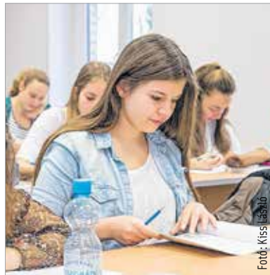
A feladatok megoldását a Studium Generale oldalán is meg lehet tekinteni

A program a felvételire és a szakokra vonatkozó tájékoztatással kezdődött: szeptembertől emberi erőforrások, gazdálkodás és menedzsment, pénzügy és számvitel, gazdaságinformatika, nemzetközi tanulmányok valamint kommunikáció és médiatudomány szakokra várják a jelentkezőket Fehérváron. A találkozóon minden szükséges információt megtudhattak a leendő hallgatók az egyetem programigazgatóitól, tanulmányi vezetőitől valamint a hallgatók képviselőitől. A tájékoztatókat követően ingyenes lehetőséget nyújtottak az érettségi előtt álló diákoknak, hogy a májusban megírandó, már tétre menő érettségi előtt a valósághoz minél közelebbi körülmények között tehessék próbára tudásukat. A próbaérettségi feladatsora struktúrájában és követelményeiben teljes mértékben megfelelt az Oktatási Hivatal által meghatározott elvárásoknak. A szervezet oktatói az összes