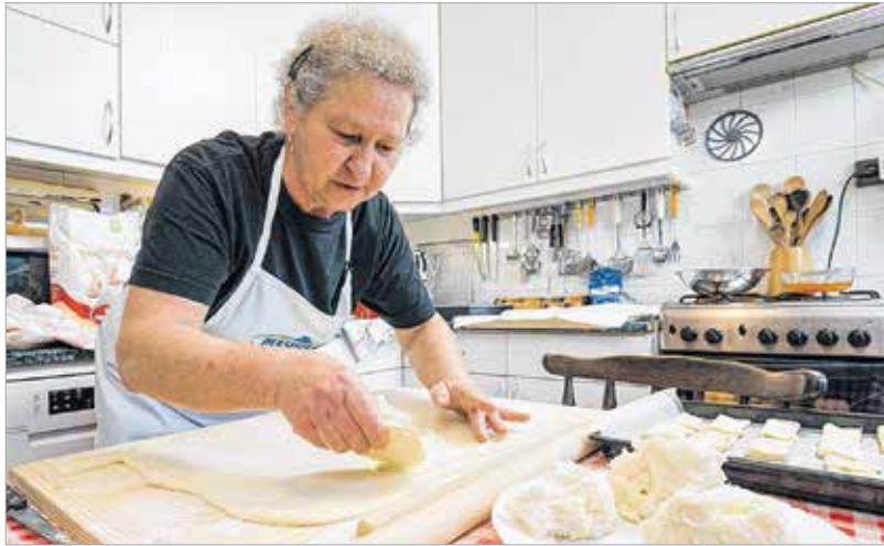
A hájat nem olyan könnyű a tésztára felvinni

Ismerjük meg a híres felsővárosi hájas pogácsát!