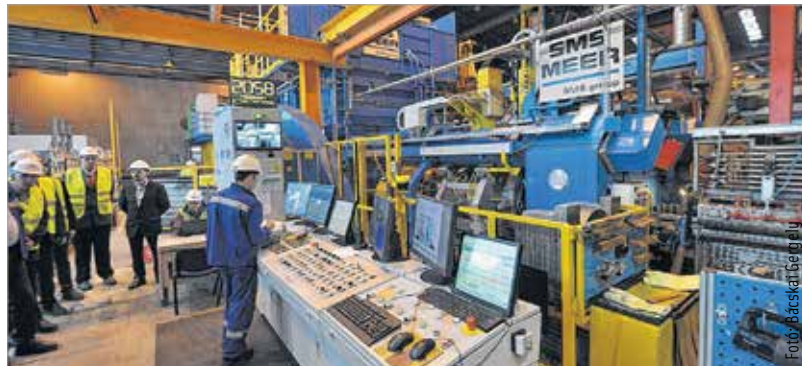
A helyi adóbevételek biztosítják a közösség számára a városfejlesztési forrásokat. Fehérváron tizenkétezer vállalkozás működik, melyek tavaly közel tizenhárom milliárd forint iparüzési adót fizettek.