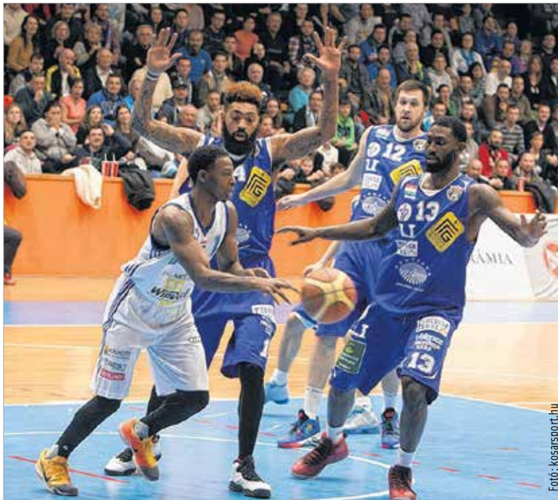
A két mezes Alba védekezése is gyenge volt az egerszegi meccs elején

Újabb lehetőség nyílik most egy ilyen sikerre: szombaton a Körmend érkezik Fehérvárra. A vasiak ősszel egyetlen ponttal nyertek úgy,