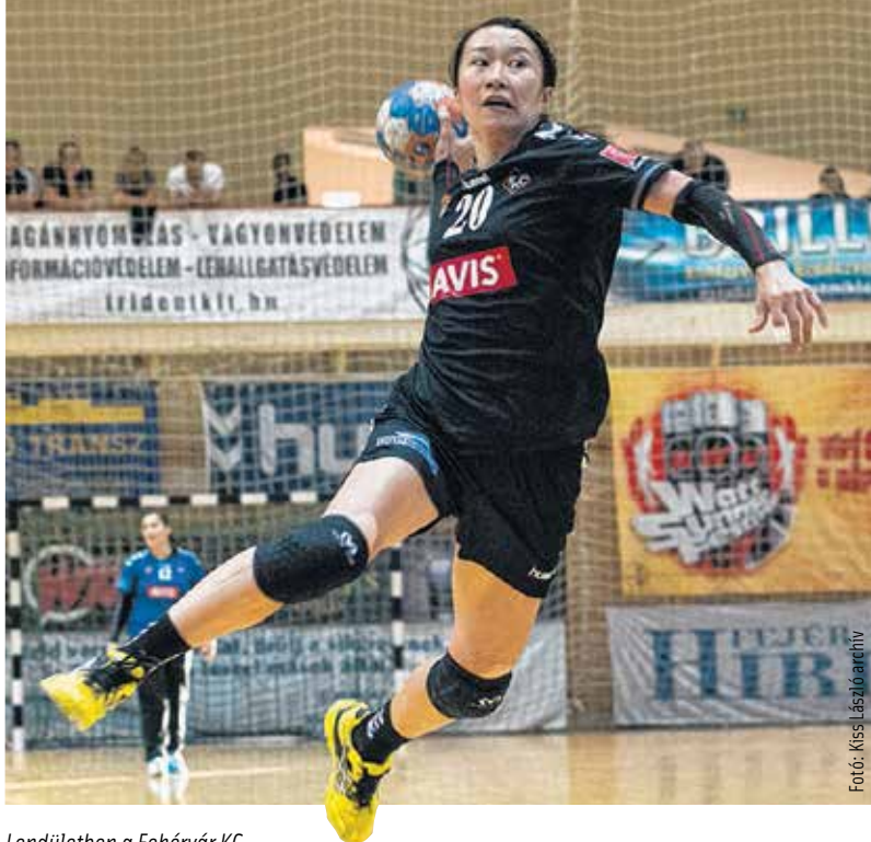
Lendületben a Fehérvár KC