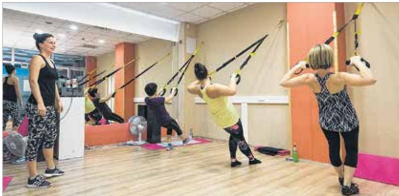
A hön áhított alak eléréséhez hetente három-négy alkalommal célszerű edzeni

„Ha jelentősebb túlsúllyal rendelkezünk, célszerű személyi edző segítségét kérnünk, aki a testalkatunknak megfelelő, izületkímélő edzéstervet állít össze részünkre. Segít az ideális étrend kiala-