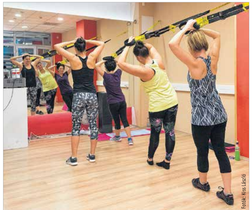
A trx az egész testet átmozgatja