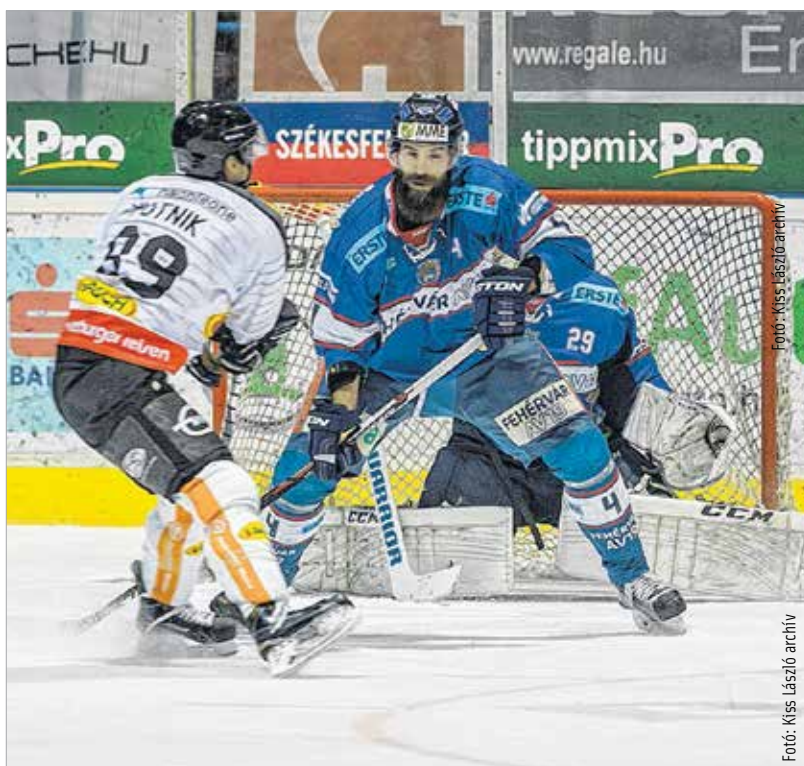
A jó védekezés már fél siker, de a rájátszáshoz gólok is ütni kell!

„Jó lenne, ha kevesebb gólt kapnánk, és többet ütnénk! Reálisan nézve,