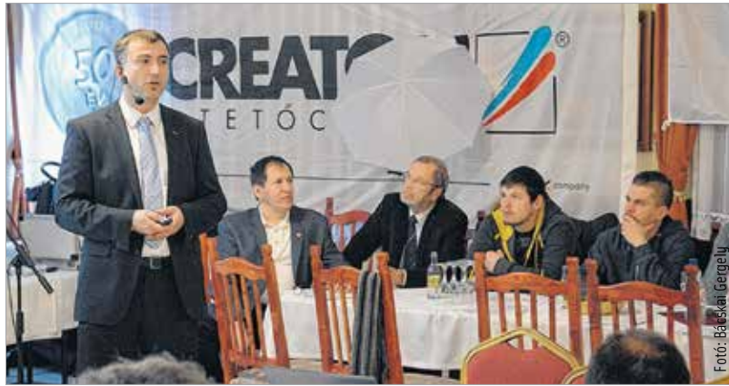
A konferencián a legújabb tetőtrendeket ismerhették meg a résztvevők