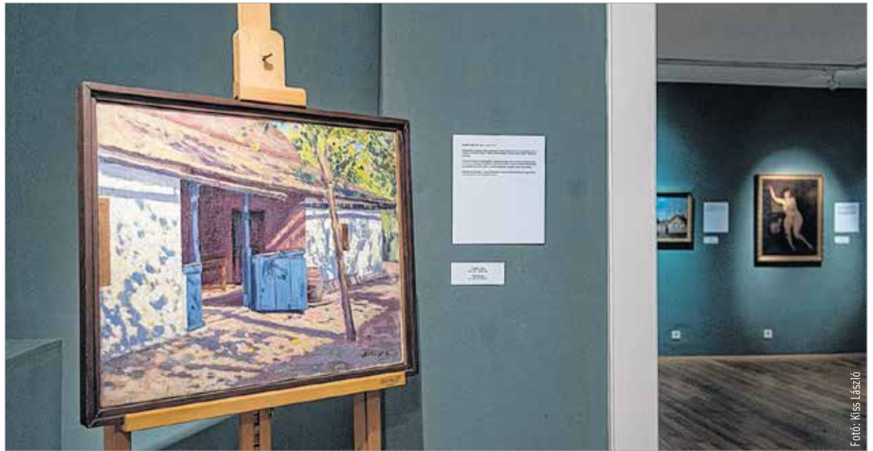
A tárlat huszonhárom alkotó életművébe nyújt betekintést. Szeptember 11-ig látogatható a Városi Képtár – Deák-gyűjteményben.

A szolnoki alkotóműhely egy tizenkét műtermes lakásból indult 1902-ben, és még ma is működik. A gyöngyházfényű ragyogás kifejezetten az itt alkotó művészekre jellemző. Ebben a térségben sok a szállópor a levegőben, ami nagyon érdekesen törli a fényt. Ennek a fénynek a visszaadása nagy kihí-