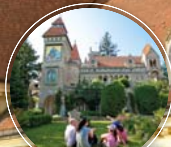
LÁTNIVALÓK TOP 5