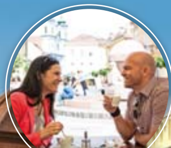
A TÖRTÉNELEM TERASZÁN